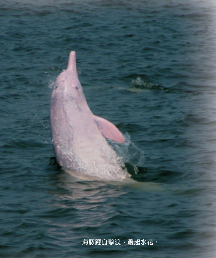
海豚躍身擊浪，濺起水花。