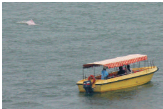
海豚在小船停下來時再次出現