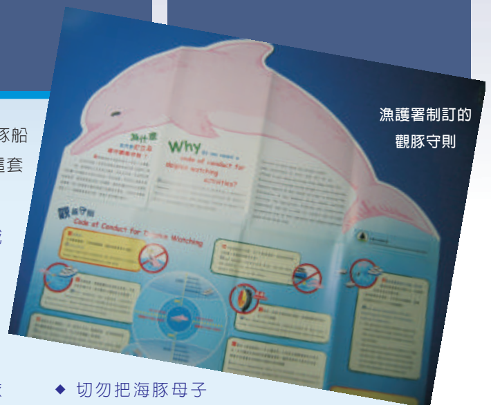
漁護署制訂的觀豚守則