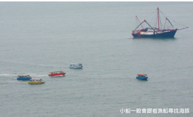
小船一般會跟着漁船尋找海豚

小船沒有特定的時間表或行走路線。他們一般會先到棚屋遊覽，之後就會駛到對開海域。如果見到漁船，就會跟着漁船嘗試找海豚；見到觀豚遊艇，也會跟着他們走走；沒船可跟就到海上兜兜風，之後便會返回市集。在海上尋找海豚的時間因船家的喜好而定，介乎數分鐘 *至22分鐘之間，平均時間約為8分鐘。如果見到海豚，小船一般都不會逗留太久。我們觀察所得，海豚首次出現後小船停留的時間平均約4分鐘，停留最長的時間為14分鐘。