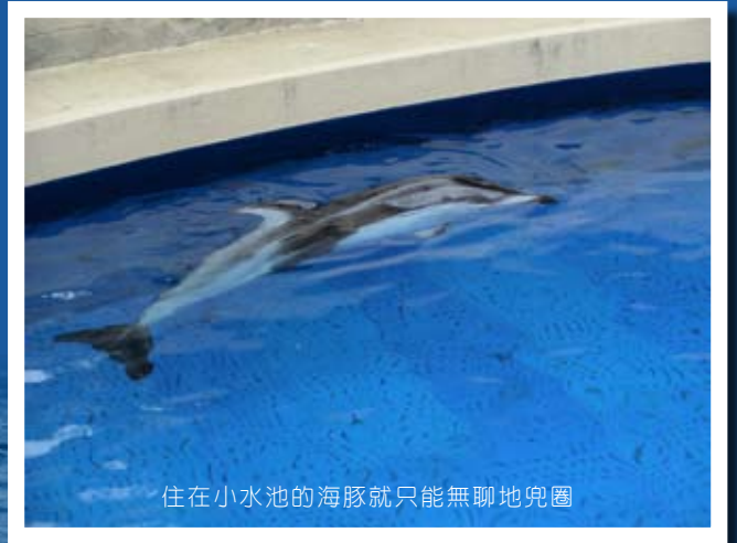
住在水池的海豚就只能無聊地兜圈

海豚是有思想、有感情的動物，這點得到很多科學家認同。海豚更是群居的野生動物，有複雜的社會結構，脫離原來的群體對牠們的心理會造成極大創傷。野外的海豚可以聯群結隊四處遊玩，但馴養的海豚終日就只能無聊地圍着小水池轉圈。住在水族館內，遠離遼闊的大海，遠離親人朋友，住在狹小的「監倉」內，被迫表演頂球跳圈和與人近距離共泳，以賺取食物。你會希望過這樣的生活嗎？