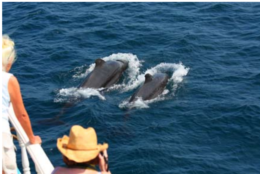
主動游近船隻的鯨豚