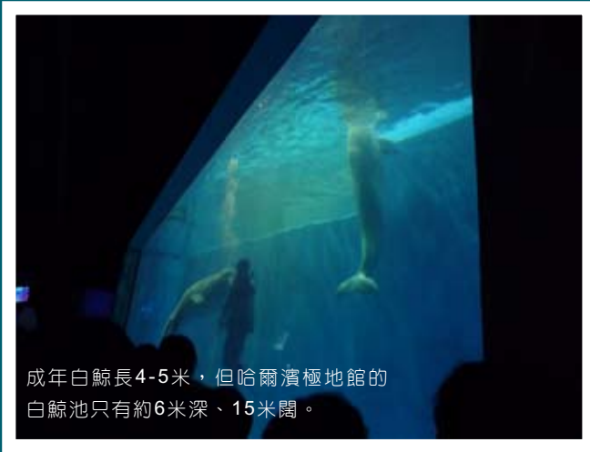
成年白鯨長4-5米，但哈爾濱極地館的白鯨池只有約6米深、15米闊。

安全抵埗之後，海豚就可以從此在人類「呵護」下快樂地生活嗎？無論水族館的水池有多大，都遠遠不能跟遼闊的海洋相比。海豚在野外生活，每日迴游於廣闊的水域，靠精密的回聲定位四出探索豐富多變的海底世界。水族館狹小的水池有的只是呆板的石屎牆，海豚發出的聲納只會生硬的反彈回來，令海豚感到迷茫。