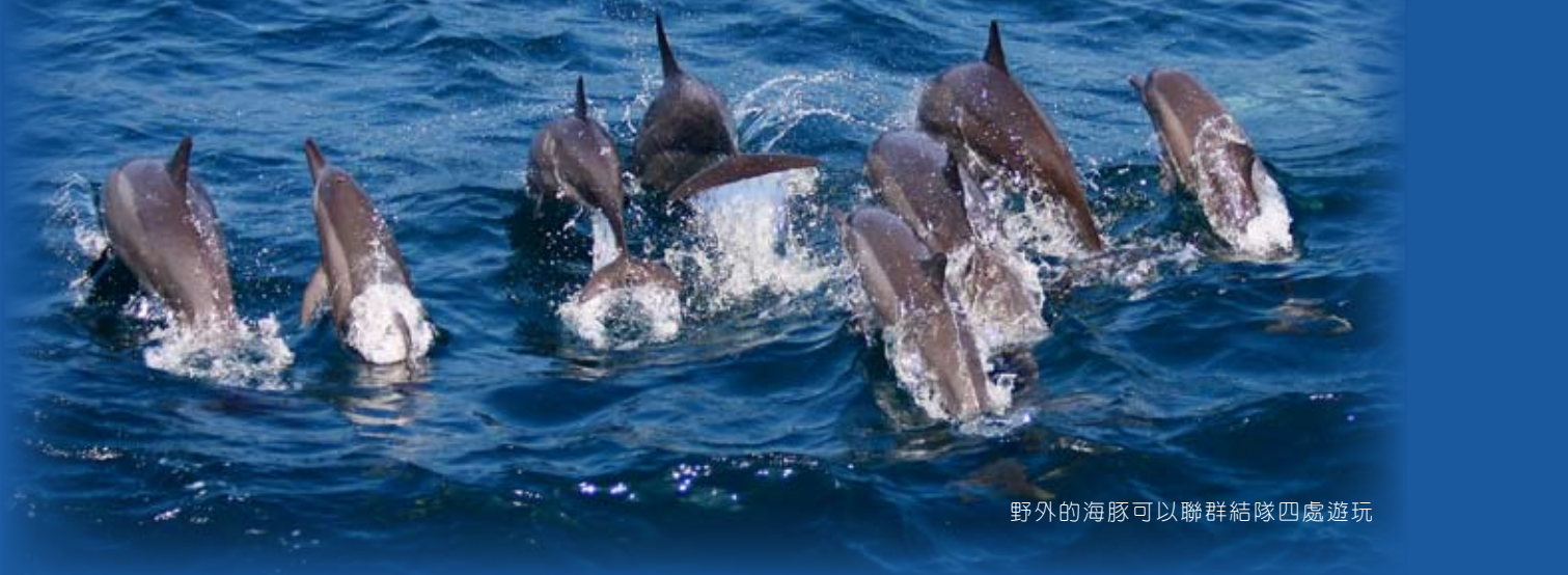
野外的海豚可以聯群結隊四處遊玩